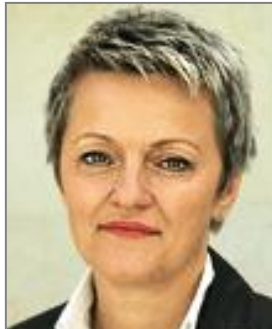
Renate Künast Bündnis 90/Die Grünen Schirmfrau der Naturkost-Akademie